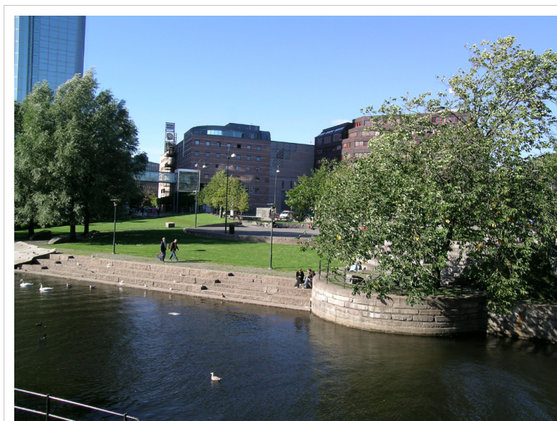
Vaterlandsparken, em Oslo.