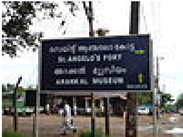
മലയാള ഭാഷയിലുള്ള ഒരു വഴികാട്ടി