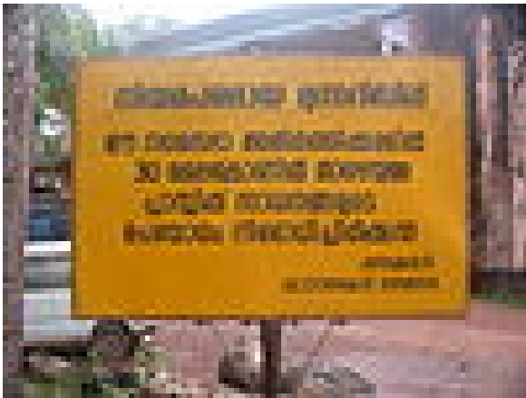
മലയാള ലിപിയുടെ ഉദാഹരണം. കേരളത്തിൽ മലയാളഭാഷക്ക് ഔദ്യോഗിക പദവിയുണ്ട്

ദക്ഷിണഭാരതത്തിൽ ലിപിവ്യവസ്ഥിതിയുടെ പ്രചാരകർ ബുദ്ധജന സന്യാസികളാണെന്നു ചില ഗുഹാലിഖിതങ്ങൾ സൂചിപ്പിക്കുന്നുണ്ട്. ഈ ലിപിയാകട്ടെ ബ്രാഹ്മി ലിപിയിൽ നിന്നു ദ്രാവിഡഭാഷകൾക്ക് അനുയോജ്യമായ രീതിയിൽ മാറ്റങ്ങൾ വരുത്തിയതായിരുന്നു. ഈ എഴുത്തുസമ്പ്രദായം പിന്നീട് തമിഴകത്തും മലനാട്ടിലും വട്ടെഴുത്ത് എന്ന പേരിൽ വ്യാപരിക്കുകയുണ്ടായി. ദ്രാവിഡശബ്ദവ്യവസ്ഥിതികൾക്ക് വേണ്ടി ചിട്ടപ്പെടുത്തിയ ഈ ലിപി സംസ്കൃത-പ്രാകൃത ഭാഷകൾ എഴുതുവാൻ