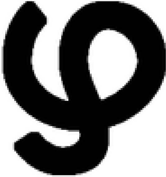
'ശ'കാരം ദ്രാവിഡഭാഷകളിൽ തമിഴിലും മലയാളത്തിലും മാത്രം ഉപയോഗിച്ചു കാണുന്ന വ്യഞ്ജനമാണ്